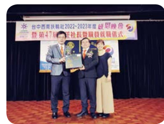
新任社長 Megane 贈送全體社友伉儷紀念品