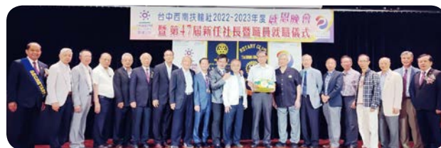
一般紅箱累計達 8500 元以上