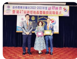
全體社友贈送卸任社長 Pneumatic 伉儷紀念品