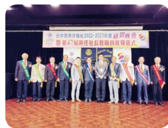
新任社長 Megane 介紹新任理事及配戴職務章