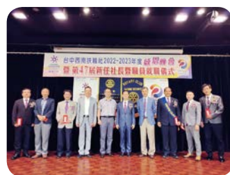
表揚第 46 屆卸任理事