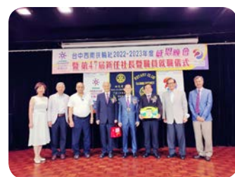
特殊辛勞獎 / 社務及活動貢獻獎