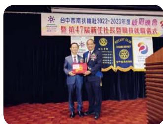
卸任社長 Pneumatic 贈送卸任秘書 Safe 紀念品