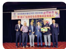
出席率 100% 連續 10 年以上