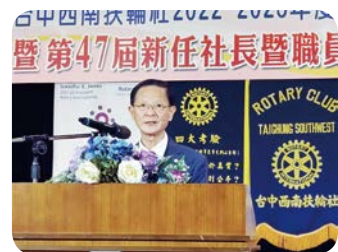
卸任社長 Pneumatic 致詞