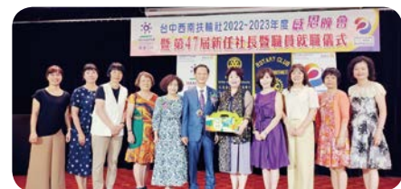
協助內輪會、結婚紀念影片製作、播放、慶生會蛋糕切送、社際接待