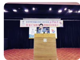
新任社長 Megane 致詞